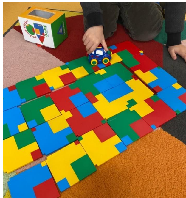
1. 2. és 3. ábrák: Konstrukciók négyzetekkel